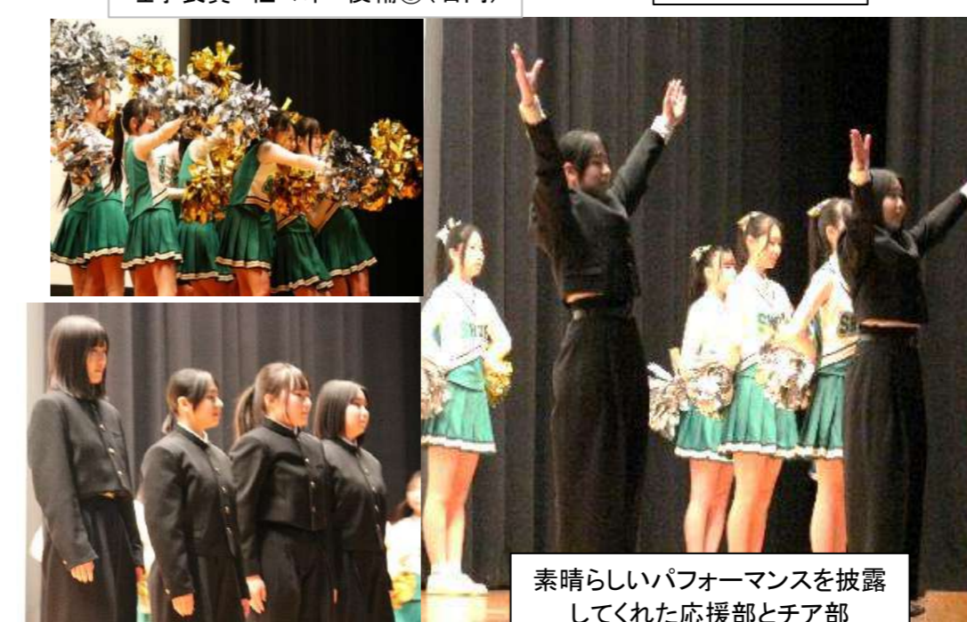
素晴らしいパフォーマンスを披露してくれた応援部とチア部