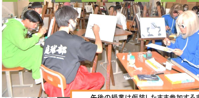
午後の授業は仮装したまま参加する非日常となりました