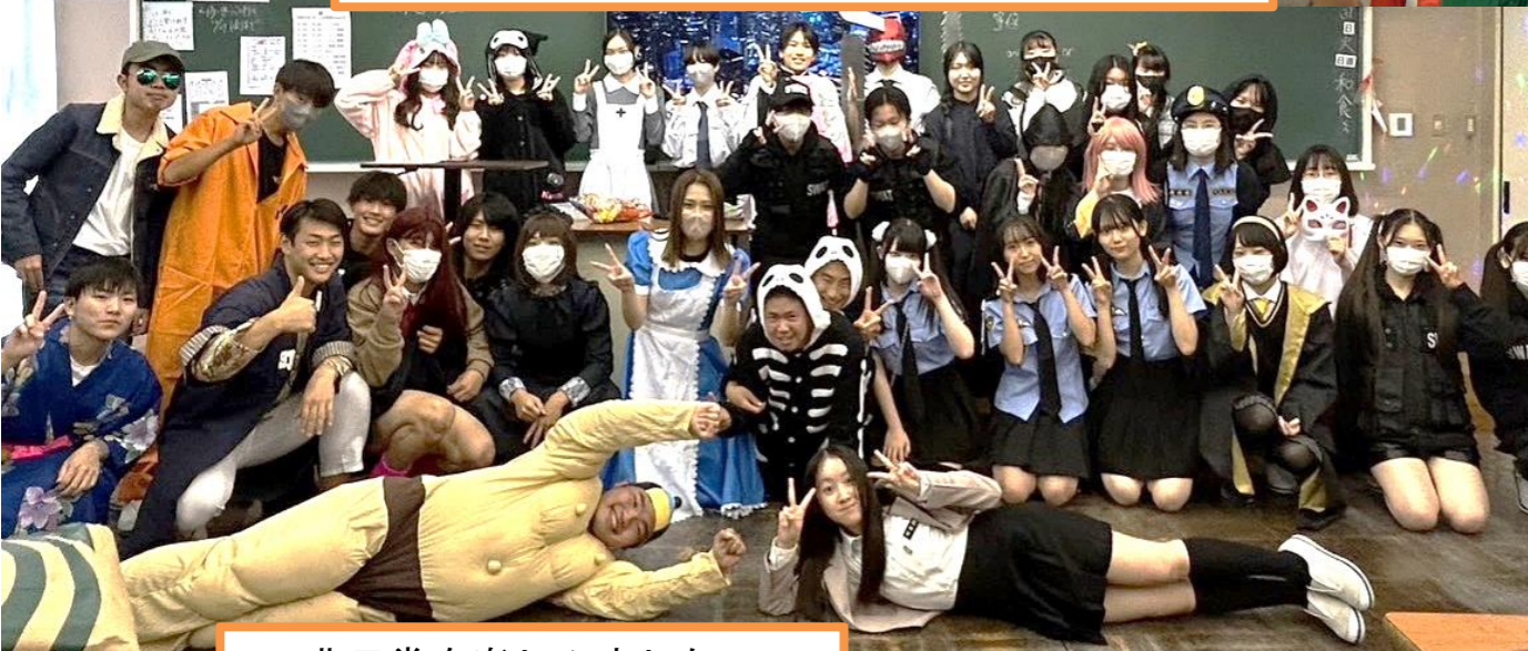
非日常を楽しみました！