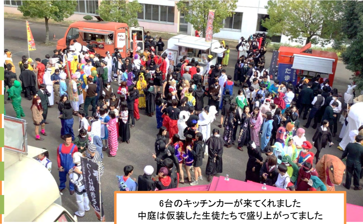
6台のキッチンカーが来てくれました 中庭は仮装した生徒たちで盛り上がっていました