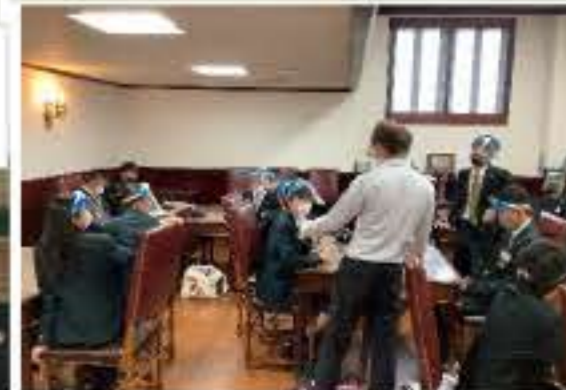
↑英会話レッスンの様子 ネイティブの先生方から英語について楽しく学びました。

ブリティッシュヒルズは福島県にあり、イギリス式の食事や文化を体験できます。英語力がなくても安心! パスポートのいらない英国に、本校から車で約3時間で着けます。