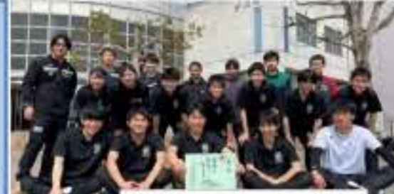
↑男子バレーボール部

秋の新人戦では県大会出場を目前にして敗退してしまい、とても悔しかったです。その悔しさをバネに練習してきた結果が、今年大会の県大会出場という結果に繋がったと思います。つくば秀英としては17年ぶりの県大会出場ですが、まずは自分たちのバレーをすることを目標に、1戦でも多く勝てるよう頑張りたいです。