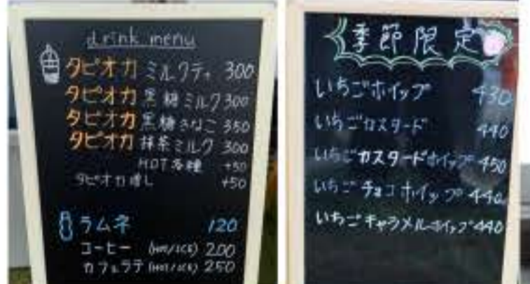
メニュー↑クレープ・かき氷・飲料が販売されています。