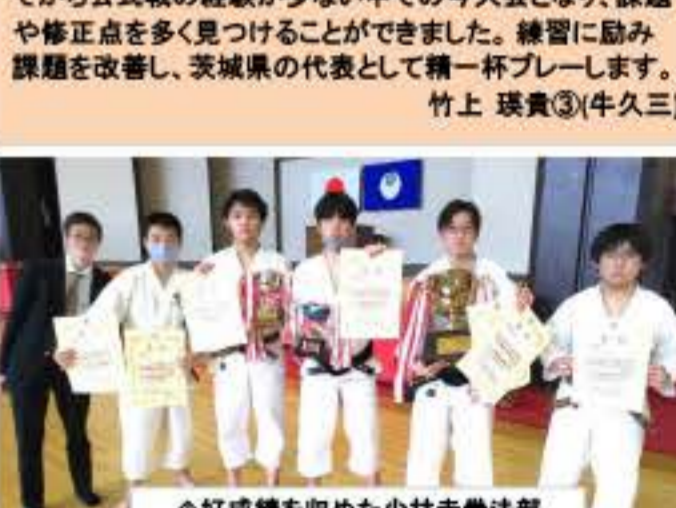
↑今年も活躍した柔道部

ラグビー部 一回戦、同点で試合が終わり抽選で勝ち取ることができましたが、3位決定戦で負けてしまい4位になってしまいました。