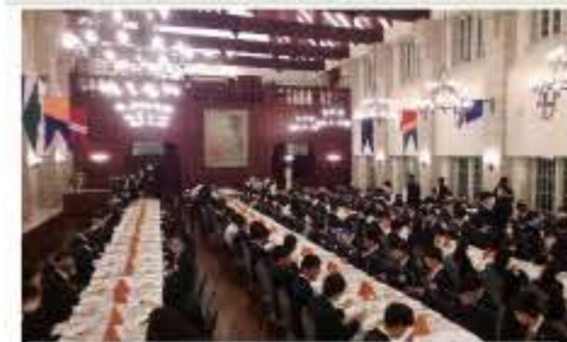
↑食事の様子 イギリス式の食事を体験しました。

英語があまり得意ではなく、この研修に不安がりましたが、語学研修でレッスンを体験している内に英語に対する苦手意識が無くなりました。授業を受けると聞いていたので、堅苦しいイメージがりましたが、実際に授業を受けてみると堅苦しいということはなく、楽しい授業でした。