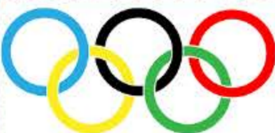
オリンピックのマーク↑

今回調べて、オリンピックは世界が一つになるピクススポーツイベントだと改めて感じました。今大会はオリンピックで33競技339種目、パラリンピックで22競技540種目が行われます。追加競技も含めて日本人選手の活躍を期待し、テレビや会場で一生懸命応援しましょう。