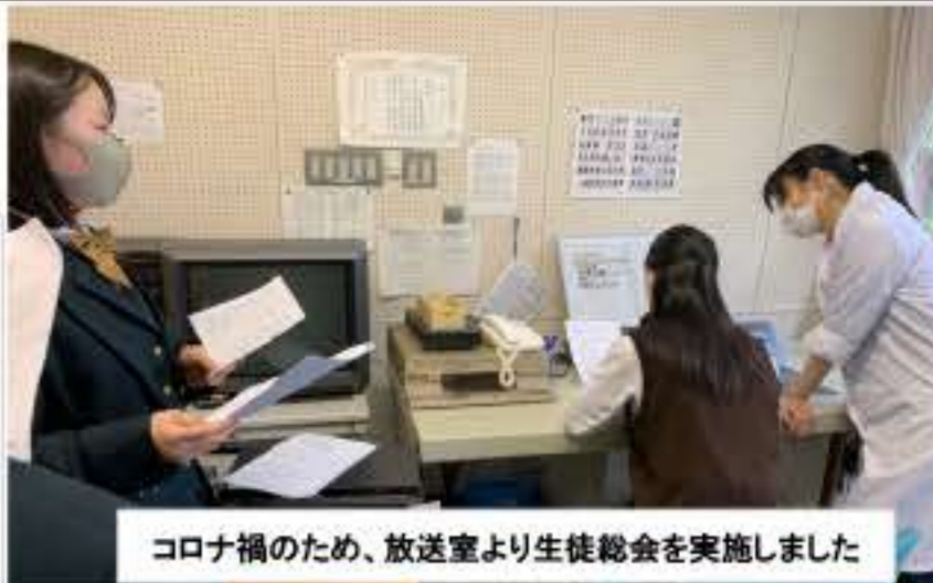
コロナ禍のため、放送室より生徒総会を実施しました