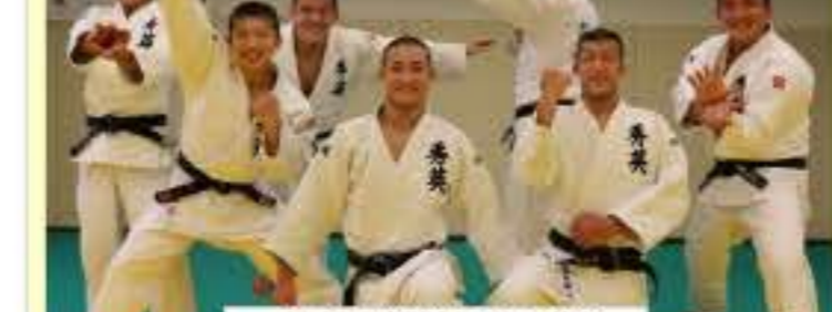
↑関東大会常連の柔道部