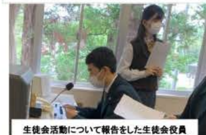
生徒会活動について報告をした生徒会役員