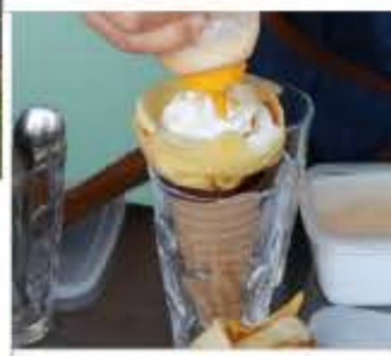
↑クレープを作っている様子