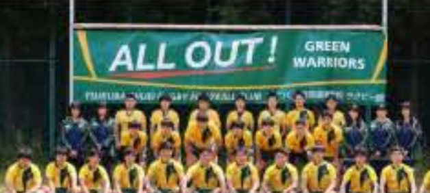
↑今年も活躍した少林寺拳法部

まず悔しいです。21秒台で走って1位という目標を立てていたのですが、22秒03で2位という結果で終わってしまいました。ですが自己ベストは出せたので自分に自信ができました。次の大会では21秒台で走り、インターハイ出場を目標にして頑張ります。