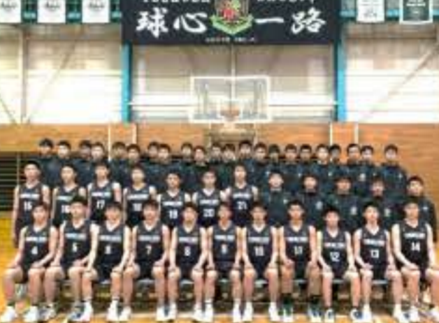
↑14回目の関東大会を決めた男子バスケットボール部