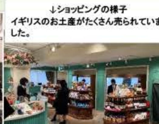
↓ショッピングの様子 イギリスのお土産がたくさん売られています。

1団が4月12日~13日、2団が13日~14日と1泊2日で、福島県白河市のブリティッシュヒルズに語学研修に行ってきました。