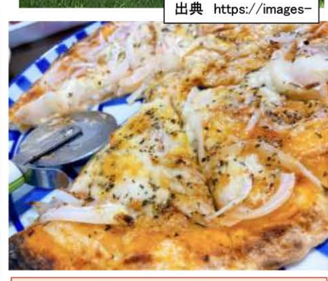
↑実際に家で作ったピザ 照り焼きピザを作りました。しっか りと焼きめもついてとても美味しくで きました。庭にタープとハンモックを 置いて、おうちキャンプが楽しめま した。