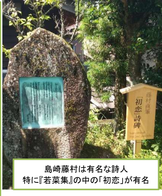
島崎藤村は有名な詩人 特に『若菜集』の中の「初恋」が有名