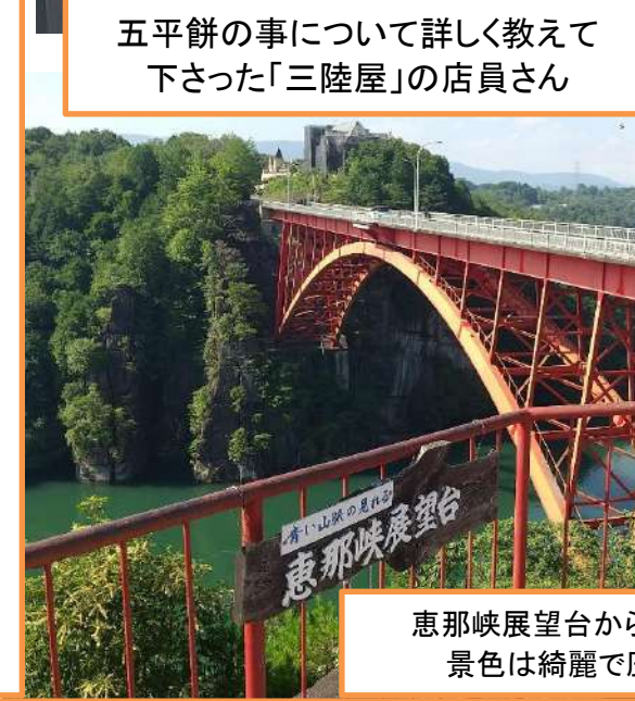
恵那峡展望台からの木曾川の景色は綺麗で圧巻でした

岐阜県東濃地方は栗きんとん発祥の地として知られています。江戸時代から栗きんとんの原形となるお菓子はあったようです。栗きんとんの形状には2種類あります。栗に甘いあんを和えて栗の形を残している「栗金団(くりきんとん)」と栗をしっかりと裏ごして成形した「栗金餛(くりきんとん)」があります。 岐阜県東濃地方の山間部では恵那栗が収穫され、加工しても日持ちがするようにアレンジした和菓子が「栗きんとんの始まり」と考えられています。 栗に甘いあんをまとわせた形状の「栗金団」が登場したのは、おおよそ明治時代の頃で、輝く金に近い色味から「金運の上がる食べ物」として、正月に食べられるようになりました。