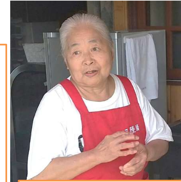
五平餅の事について詳しく教えて下さった「三陸屋」の店主さん

←栗きんとん(260円) ざらつとした舌触りで甘さ控えめで栗本来の味を楽しめます。渋皮の入った栗のペーストが、渋いお茶によく合う一品です。