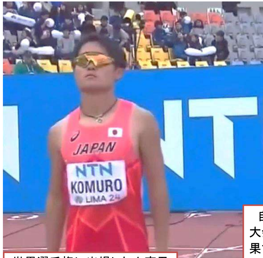
世界選手権に出場した小室君