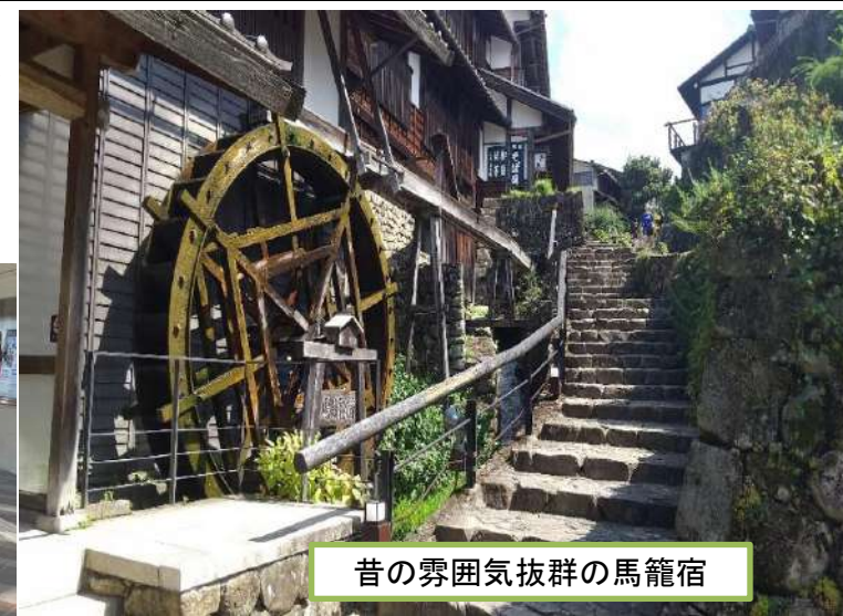
昔の霧気抜群の馬籠宿

馬籠宿を散策しました。馬籠宿は江戸時代の参勤交代で多くの人が行き交った、中山道43番目の宿場町です。ノスタルジックな霧気抜の宿場町で石畳が敷かれた坂道の両側には、おやき、五平餅やお土産屋さん、昔ながらのカフェなどが並び、食べ歩きや散策が楽しめるスポットです。また、島崎藤村のゆかりの地でもあり、島崎藤村記念館もあります。(入館料500円)