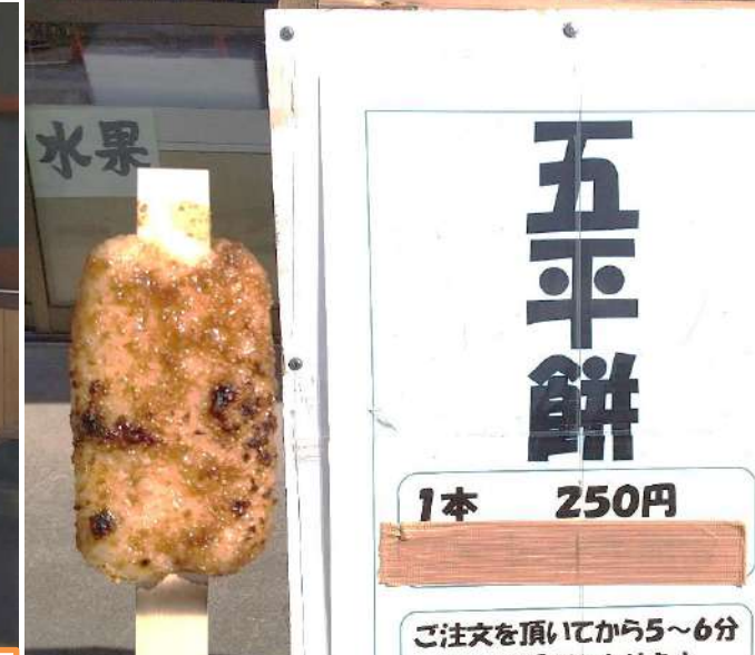
↑わらじ型(250円) 団子型(180円)↓