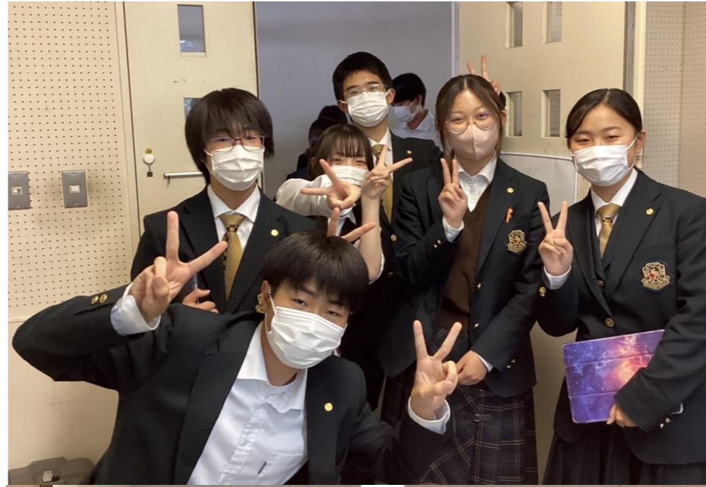
今年も放送室から生徒総会を行いました