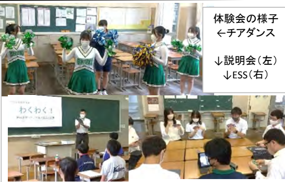
体験会の様子 ←チアダンス ↓説明会(左) ↓ESS(右)