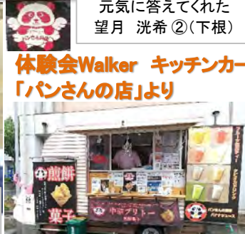
体験会Walker キッチンカー「パンさんの店」より