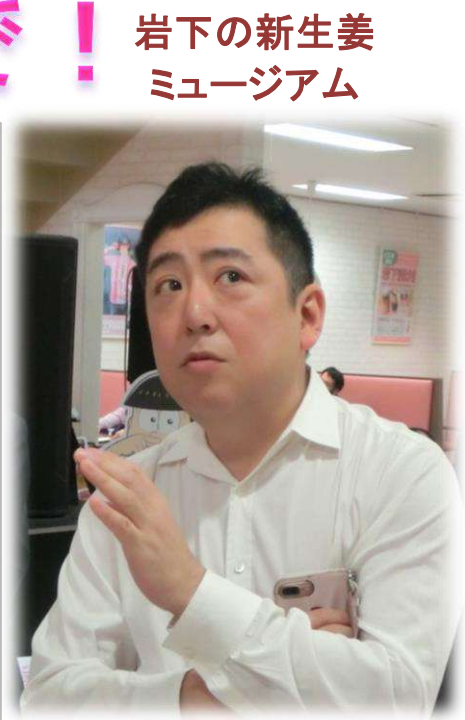
岩下の新生姜ミュージアム